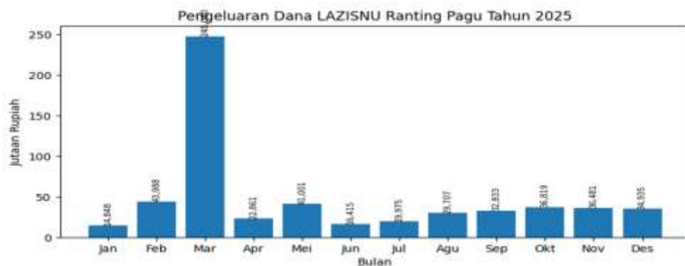
Tabel 3. Data Pengeluaran Dana LAZISNU Ranting Pagu Tahun 2025

Sumber: Data keuangan Lazisnu Ranting Pagu tahun 2025, diolah peneliti (2026)